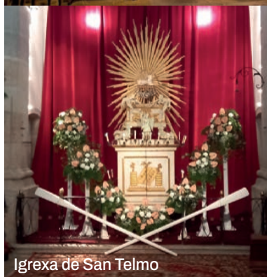
Igrexa de San Telmo