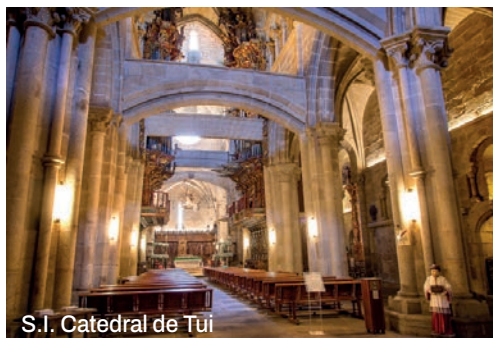
S.I. Catedral de Tui