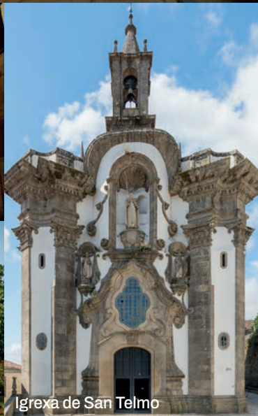
Igrexa de San Telmo